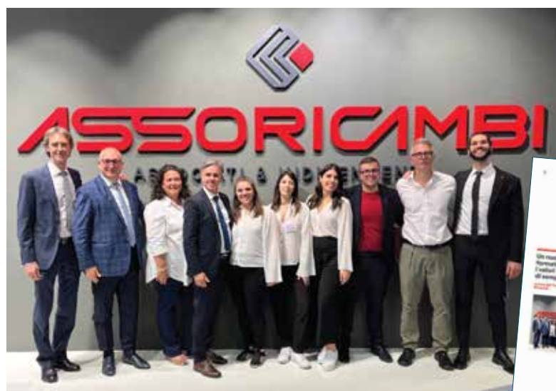
Foto di gruppo per il team editoriale di Aftermarket Review